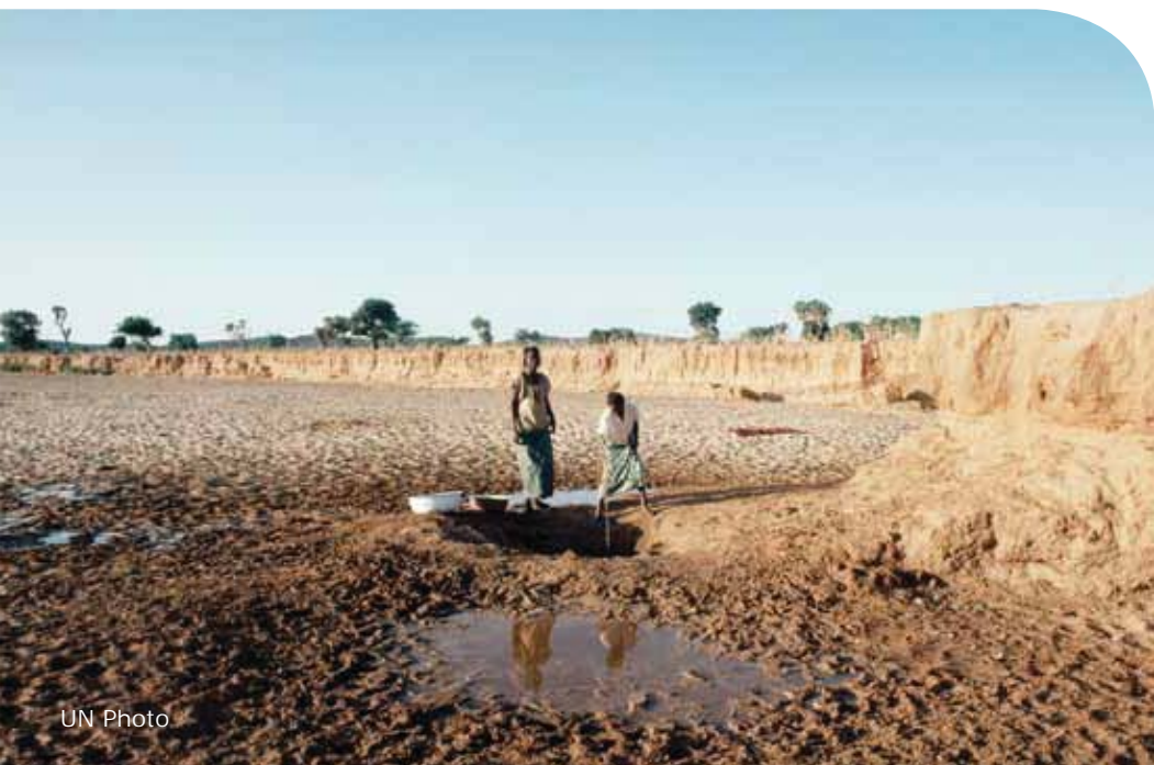
Wyschnięte koryto rzeki w Nigrze