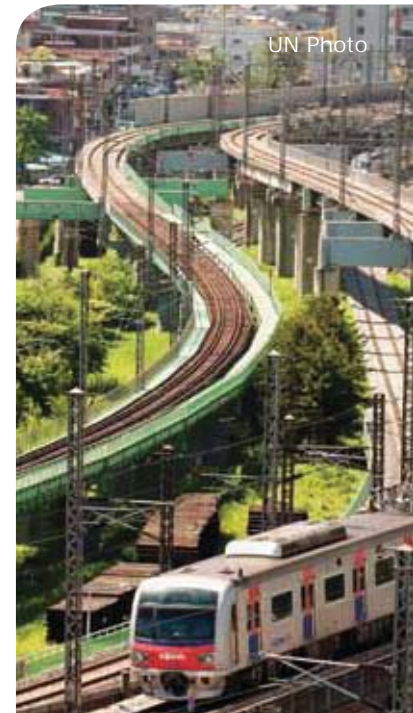
Tory kolejowe wijące się przez Seul, Republika Korei

► Zwiększanie zużycia energii odnawialnej , co może znacząco obniżyć emisję dwutlenku węgla oraz poziom zanieczyszczeń na zewnątrz i wewnątrz pomieszczeń, jednocześnie przyczyniając się do wzrostu gospodarczego.