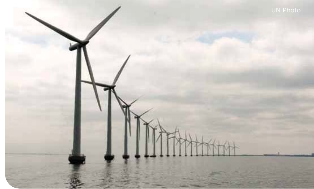
Middelgrunden - farma wiatrowa na morzu, Dania

► Przechodzenie do bardziej zielonej gospodarki , jednocześnie koncentrując się na eliminacji ubóstwa.